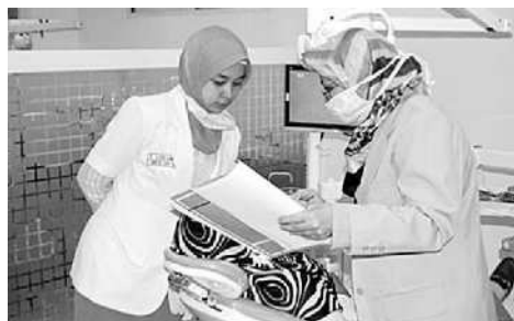
Mahasiswa kedokteran mengikuti ujian praktik kedokteran di rumah sakit

Anggaran pemerintah mesti dioptimalkan lebih baik lagi untuk meningkatkan mutu layanan kesehatan yang memadai. "Dibanding anggaran plesiran anggota DPR ke luar negeri dan tidak ada hasilnya, lebih baik biayanya dipakai ngurusin layanan kesehatan yang masih minim," kritik Jane. ■ UZI