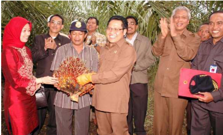
■ Menteri Tenaga Kerja dan Transmigrasi Muhaimin Iskandar, melakukan panen raya kelapa sawit di KTM Geragai, Jambi.

Kondisi di atas, direspon para pemimpin dunia dan termasuk kawasan Asia Timur dalam Konferensi Tingkat Tinggi Asia Timur di Singapura yang menjadikan isu pemanasan global sebagai pembahasan utama. 10 Pemimpin Asia Timur yang terdiri dari negara Asean ditambah China, Jepang, Korea Selatan, Australia, India, dan Selandia Baru menandatangani "Deklarasi Singapura untuk Perubahan Iklim". Deklarasi ini menyuarakan kepada 16 negara untuk berperan aktif mewujudkan cetak biru lingkungan yang baru, menggantikan Protokol Kyoto yang akan habis masa berlakunya pada 2012.