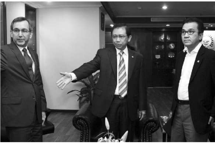
Malaysia Tangkap WNI Pemberontak

Demokrasi (NLD) memenangkan secara besar-besaran pemilu terakir negara pada 1990, tetapi tak diizinkan mengambil alih kekuasaan oleh jenderal-jenderal yang berkuasa. NLD kemudian bubar, sedangkan sebagian anggotanya membentuk partai baru untuk bisa ikut ambil bagian dalam pemilu yang rencananya akan digelar pada 7 November.