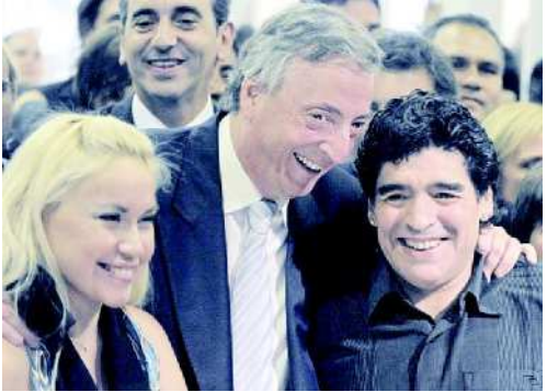
Maradona (kanan) tidak simpatik pada Paul.

Dalam pesannya Maradona menunjukkan sikap kurang berempati atas kematian gurita yang telah menghebohkan jagad sepakbola dunia itu. “Saya senang si gurita peramal itu telah tiada karena Anda memberikan kontribusi bagi kekalahan kami di Piala Dunia,” kata Maradona dalam akunnya. Namun demikian sejauh ini masih belum ada konfirmasi resmi apapun dari pihak Maradona apakah akun Twitter itu memang benar miliknya. ■ ULU