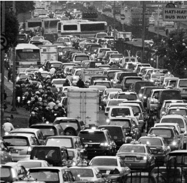
CHARLIE LOBUILLIA (INDO POS)

"Pihak Yamaha mengikuti apapun peraturan yang ditetapkan pemerintah, karena ini mungkin erat kaitannya dengan perbaikan kondisi yang ada saat ini," katanya. ■ CR-NDA