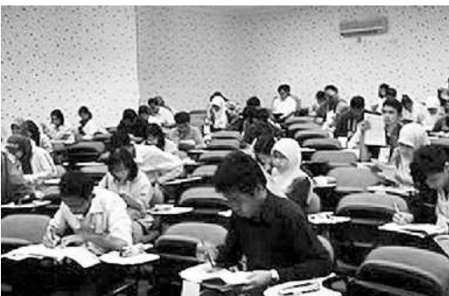
Para sarjana kedokteran mengikuti uji kompetensi dokter Indonesia di Jakarta.

tidak akan menjadi persoalan ketika seleksi masuk perguruan tinggi khususnya kedokteran juga bermutu. "Apalagi perguruan tinggi yang memiliki fakultas kedokteran itu memiliki akreditasi dan standarisasi," katanya.