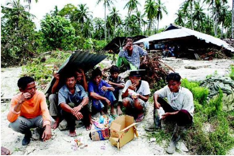
BERTEDUH SENG: Beginilah kondisi korban tsunami Mentawai, Sumbar, kemarin.

Hingga kini, diakui Haryono, belum ada perkembangan berarti dari penanganan kasus tersebut. KPK sedang mempersiapkan langkah-langkah yang akan diambil jika Nunun tidak juga bisa hadir atau tidak ditemukan. ■ JON