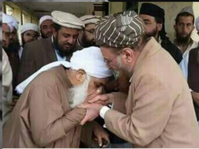
دیوبندیان څوک دي؟ (3)