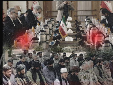
په شرعي (!) نظام کې رافضي محتسبین