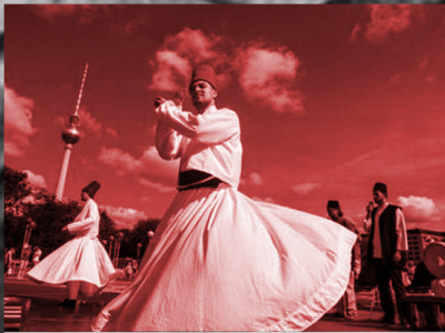
د تصوف بنیاد نړولو سره شرافت حاصلول (5)