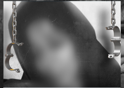
د عافیې د وا معتصماه غږ ته به څوک لیک ووايي؟!